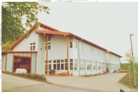
Werkstätte für Behinderte in Gerlachsheim

Um Menschen, die einsam und pflegebedürftig sind, die unter Arbeitslosigkeit oder Armut leiden, die in Behindertenwohnheimen und Altenpflegeheimen leben, oder die sich in anderen Notlagen befinden, adäquat helfen zu können, reichen die vorhandenen finanziellen Mittel oft nicht aus.