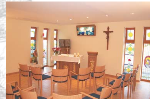
Die Kapelle im Johann-Bernhard-Mayer Altenpflegeheim in Lauda wurde durch Spenden finanziert.

Über den Tod hinaus sozial handeln, diesen Wunsch können sich Menschen erfüllen, in dem sie schon zu Lebzeiten der Caritasstiftung Geld oder ein Grundstück zukommen lassen. Sie können auch die Gestaltungsfreiheit ihres Testaments nutzen, und einen Teil ihres Nachlasses der Caritasstiftung im Tauberkreis vermachen. Wenn es ein zweckgebundener Nachlass sein soll, lassen Sie die Verwendung festschreiben. Gerade wenn keine Nachkommen da sind oder diese in wirtschaftlich gesicherten Verhältnissen leben, ist die Entscheidung, langfristig Gutes zu bewirken, einfach.