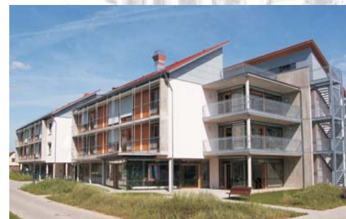
Johann-Bernhard-Mayer Altenpflegeheim in Lauda

Ein Stiftungsrat wacht über die Einhaltung des Stifterwillens!