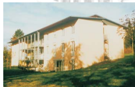
Wohnheim für psychisch Kranke St. Bonifatius in Tauberbischofsheim

Im Jahr 2002 gibt es beim Caritasverband im Tauberkreis e.V. 15 Beratungsdienste, drei Caritas-Werkstätten und drei Wohnheime für behinderte und seelisch kranke Menschen. Daneben ist der Caritasverband Träger von drei Altenpflegeheimen. Er bietet ca. 310 Mitarbeiterinnen und Mitarbeitern und 300 Werkstattbeschäftigten, also insgesamt 620 Menschen, einen Arbeitsplatz. Im sozialen und pflegerischen Bereich werden die Kosten immer enger kalkuliert - Planstellen für qualifiziertes Personal werden weniger. Manchmal ist das Notwendige fast nicht mehr machbar.